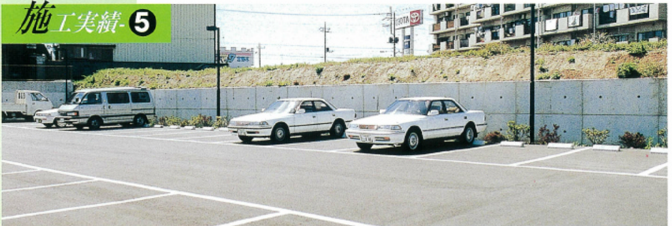
さまざまな現場に対応が可能(千葉県千葉市花見川区畑町)