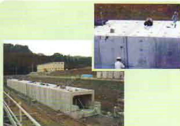
施主 国土交通省 東北地方整備局 岩手工事事務所 工事名 板田排水樋門新設工事 B×H 4000×2600