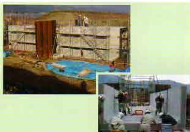
施主 近畿地方整備局 和歌山河川国道事務所 工事名 鶏樋門築造工事 B×H 3500×3500