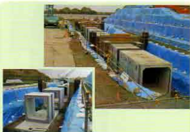
施主 関東地方整備局 利根川上流河川事務所 工事名 谷田川第一排水樋管改築工事 B×H 2300×2300