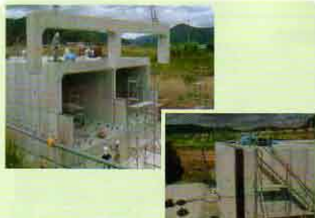
施主 国土交通省 近畿地方整備局 福知山工事事務所 工事名 尾藤川樋門築造工事 B×H (5800+5800)×4000