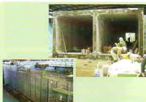
施主 北海道開発局 石狩川開発建設部 千歳河川事務所 工事名 志文別樋門（石狩川水系千歳川） B×H (3000+3000)×3000