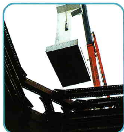
4 基礎上へ吊り降ろし