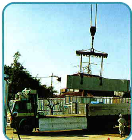
1 トラックより吊り降ろし